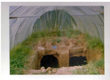
Four de tuilier