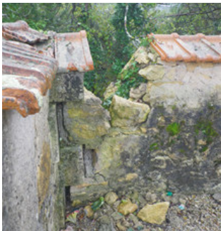
Mur du cimetière

Des travaux sont prévus pour remplacer le mur existant par une clôture.