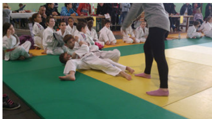
Immobilisation en gesa gatame

Pleine forme pour l'association dont les effectifs sont passés de 82 à 120 licenciés. Ce succès est dû à la diversité de ses activi-