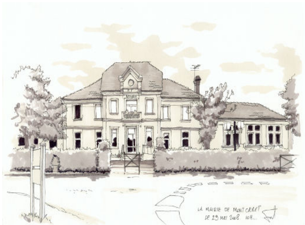
Dessin de Fred (L'Hybride), Graphiste